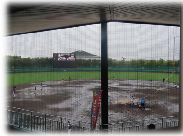
軟式野球（成年男子）試合風景