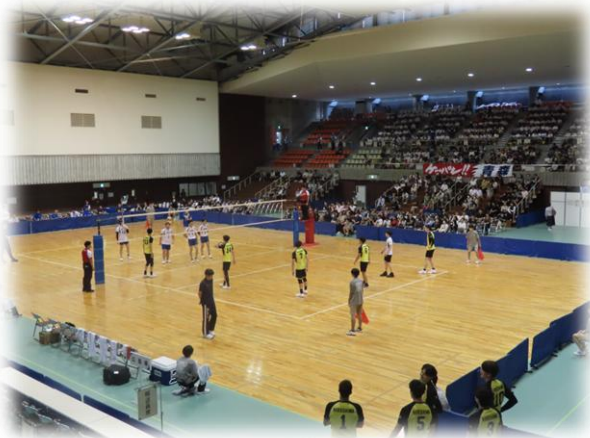
バレーボール（成年男子）試合風景