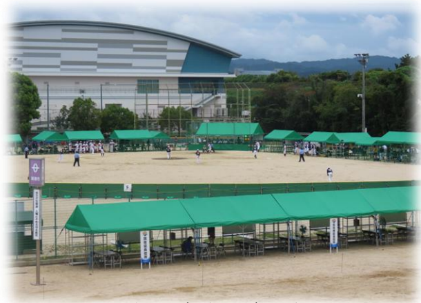
ソフトボール（少年男子）試合風景