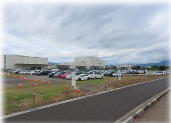
三ツ池運動公園（シャトルバス発着所&駐車場）