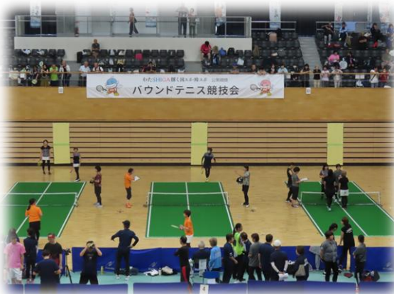
公開競技 バウンドテニス 競技風景