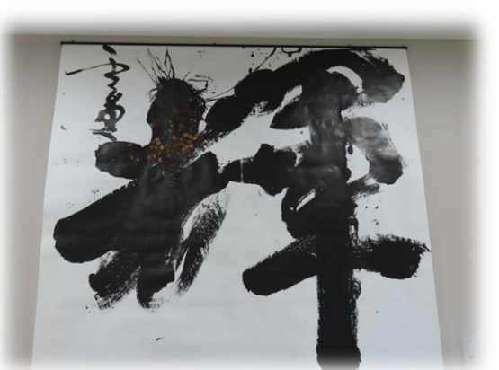
（YMITアリーナ 2 階に展示）

KUSATSU BOOSTERS 秀蓮さんの作品 「草津市では国スポにかかわるすべての人が輝ける大会を目指す」との思いを込めて制作された作品です