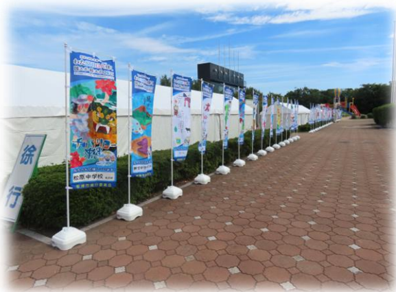
市内の生徒・児童作成の応援旗