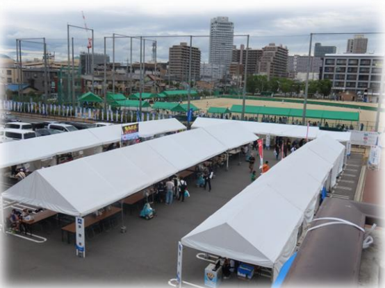
野村運動公園・野村公園 おもてなしエリア