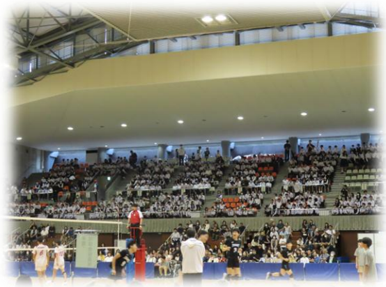
総合体育館（市内生徒・児童による観戦）