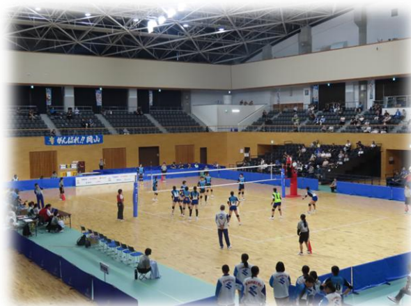
バレーボール（成年女子）試合風景