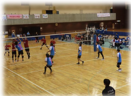
障スポ バレーボール試合風景