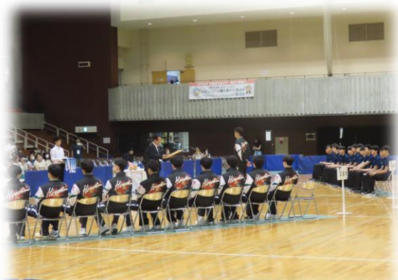
バレーボール（成年男子）表彰式