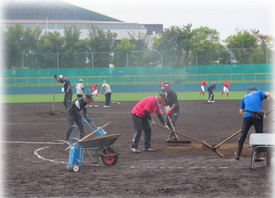
雨の中のグラウンド整備