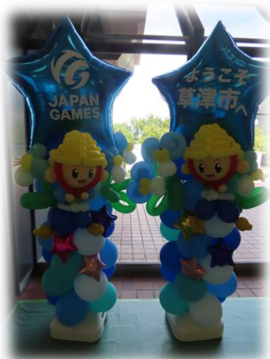
総合体育館ロビー